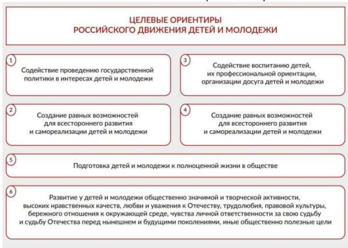
Рис. 2. Целевые ориентиры РДДМ (ФЗ № 261 от 14.07.2022: ст. 2, п.1)

объединившихся на основе общности интересов для реализации общих целей.